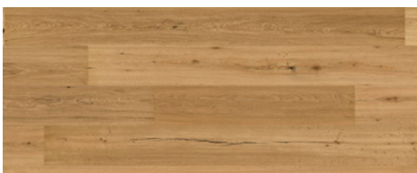
BSP: Parkett naturgeölt „Afrika“